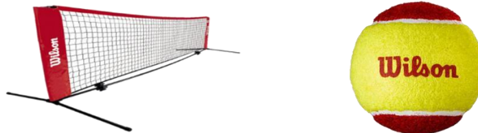
Figure 7 - Filet autoportant (minimum 5,5 mètres) et balle "Stage 3 feutrée" (9cm de diamètre)