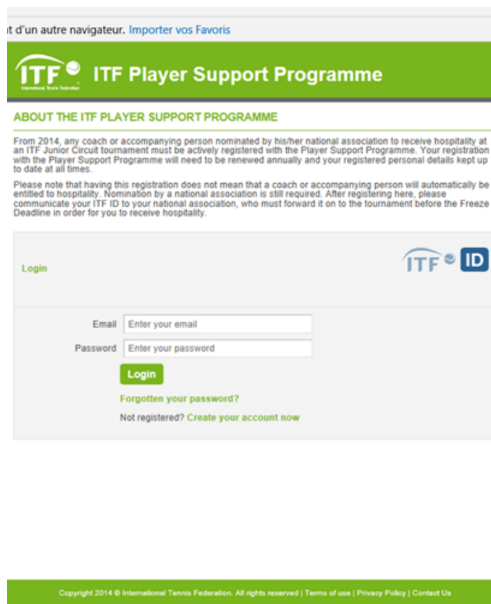
Figure 5 : Player support Program identification